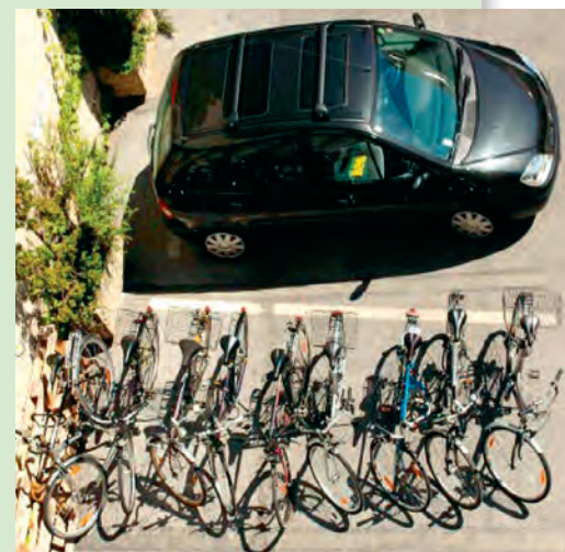
Radfahren spart Platz

Und das passiert schon in New York, Paris, Amsterdam oder Kopenhagen, und auch in Wiener Neustadt, Wolfurt oder der Radregion Linz Land. Schau's dir auf Youtube an: „Wolfurter Weg“